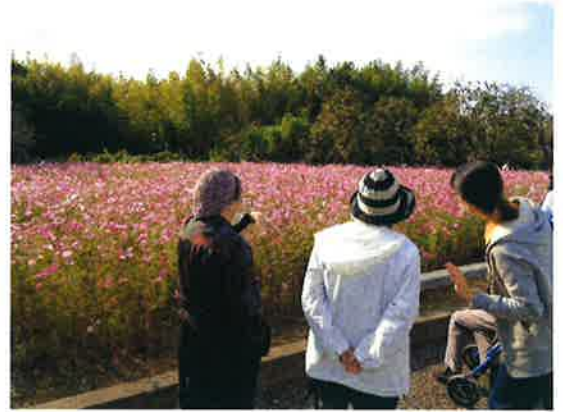
(↑)穏やかな風に揺れるコスモスを 暫く、眺めていました。