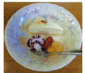
(↑)今回の誕生会メニューです(↑)