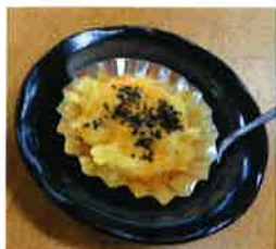
(←)じっくり焼いて 完成です。 熱いお茶と一緒に 召し上がれ！