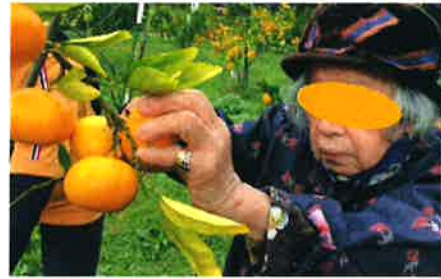
(去年のみかん狩りの様子です。)

11 月は、松生園名物の みかん狩りを予定しています。 甘いミカンが沢山実っていて ほしいですね！