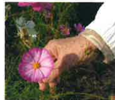
(↑)変わった 花びらです！