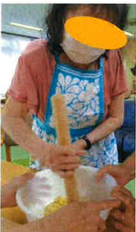
(↑)しっかり潰します！ 「もっとですか！？」