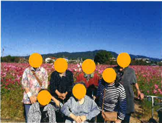
(↑)皆様、笑顔で「ハイ、チーズ！」