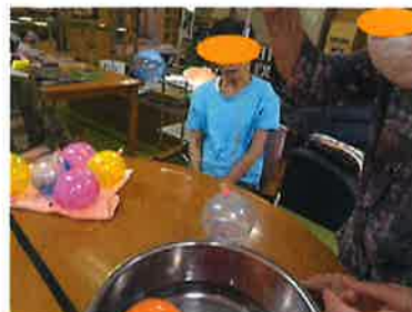
(去年の夏祭りの様子です。)