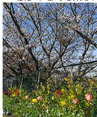
(←)桜と菜の花 チューリップとネモフィラ です！