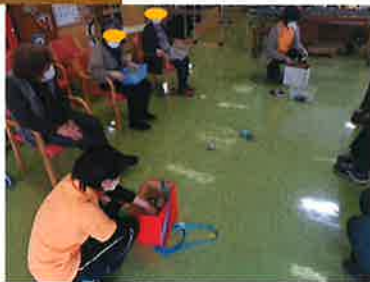
(↑)動く玉入れは 白熱しました！