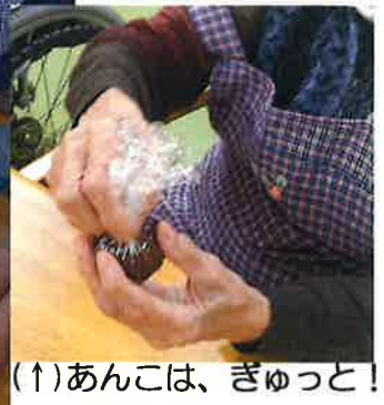
(↑)あんこは、ぎゅっと！