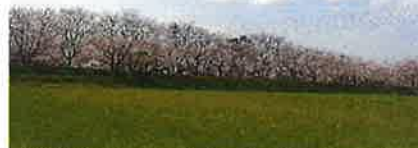
(↑)遠くから見ても綺麗です。