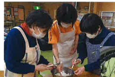
(←)ご飯を潰します！ 半殺し派と皆殺し派 で意見が分かります。