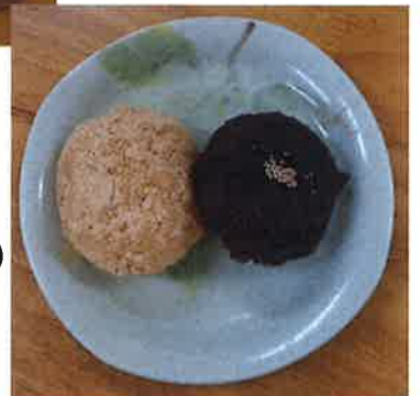
食べ応えがある 二色おはぎが 完成です！！(→)