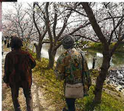
桜並木をゆっくり 散歩中です。(→)