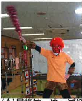
(↑)最後は、やっぱり 鬼は外！！