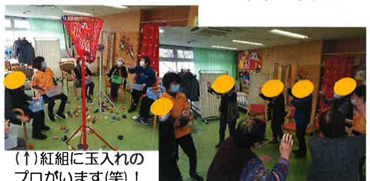
(↑)紅組に玉入れの プロがいます(笑)！