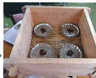
(↑)せいろで蒸します！