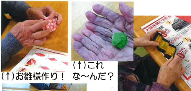
(↑)お雛様作り！ な〜んだ？ (↑)これ