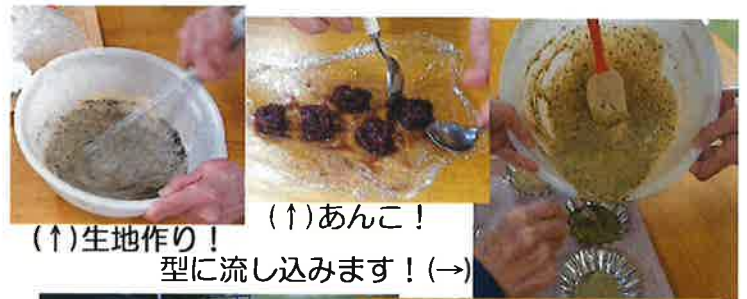
(↑)生地作り！ (↑)あんこ！ 型に流し込みます！(→)