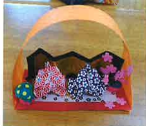
(←)完成！！ 皆様のご自宅に飾られています。 (緑の丸は、橘に使いました！)