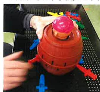
(↑)黒ひげ危機一髪！ このあと、飛びました！