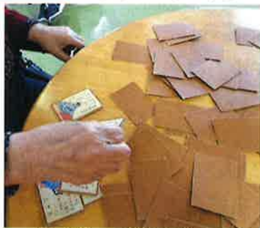
(↑)ポーズめぐり！ 最後の一枚は…!?