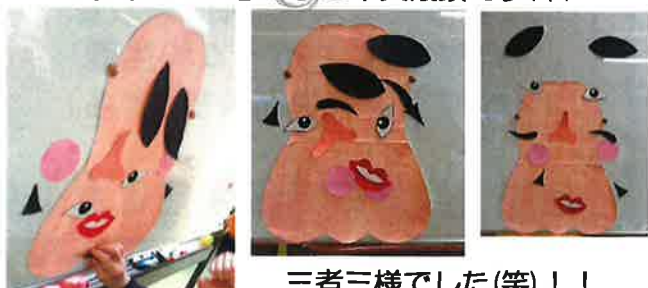
三者三様でした(笑)！！