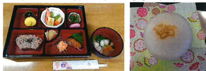
(↑)今年のおせちですと干支饅頭です(↑)